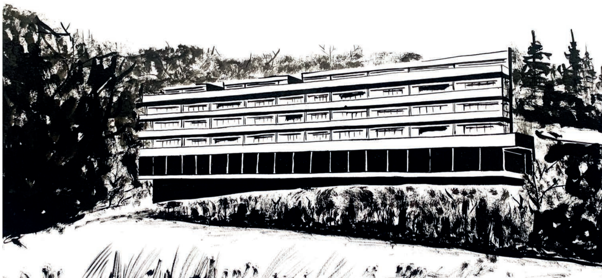
La façade Est du proje, vitrée, au coeur des jardins du Bocage.

Une maquette du projet a été réalisée pour illustrer la démarche architecturale. Elle est visible dans nos locaux.